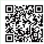
Disinfection of SARS-CoV2 by AG アルキルグリコシドによる新型コロナウイルスの消毒

詳しい情報は弊社ホームページまで http://www.dikk.co.jp/covid-19