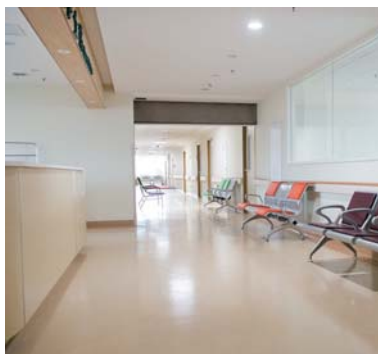
施設空間・椅子・手すり