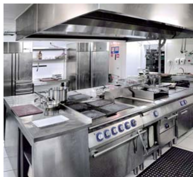
シンク・レンジ・フード