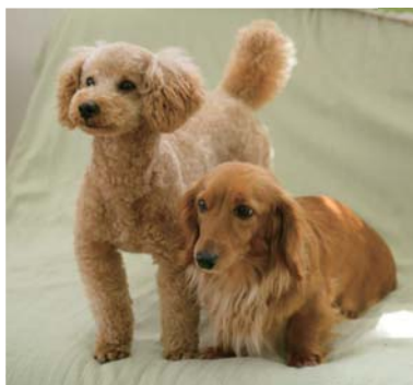
ペット用品・ケージ