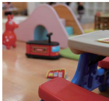
遊具・玩具・キッズルーム