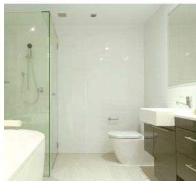
バス・トイレ・洗面台